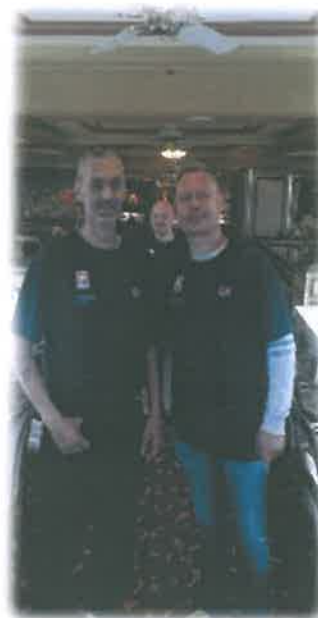
Vinnere av B-pulja