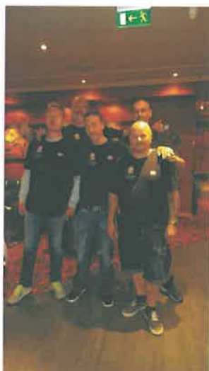
Fem glade vinnere