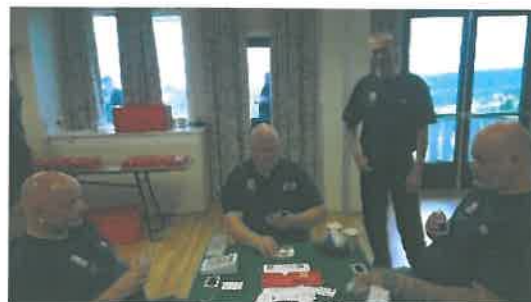
Gutta i dyp konsentrasjon