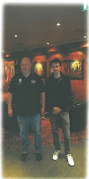
Vinnere av Mesterpulja