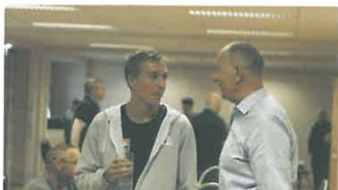
Et ivrig makkerpar i systemdiskusjon. Ungdommen får gode råd fra en eldre, mer rutinert spiller.

Oppsummert mangler jeg ord for å uttrykke denne festivalen, men håper å se deg neste år. Da blir det storturnering over 3 dager, Bridge For Alle og en åpen landslagssamling i forkant. Selvsagt blir det flere, mindre turneringer også.