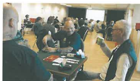
God stemning preget turneringen