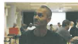
Hvor kan jeg hente overstikket tro??

Helgen på Storefjell ble avsluttet med en stor turnering der vi spilte 94 spill. Vi begynte med 5 spill pr. runde, men kortet dem til 4 for at det skulle gå opp. Det stilte mange toppspillere til start, og feltet var preget av tittelinnhavere an mas, men alle møtte alle. Det var utrolig gøy, men selvsagt rått parti. Derfor ble turneringen delt i 2 grupper, nemlig Mesterpuljen og B-puljen, «turistklassen», om du vil.